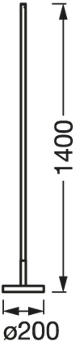
SMART WIFI FLOOR ROUND